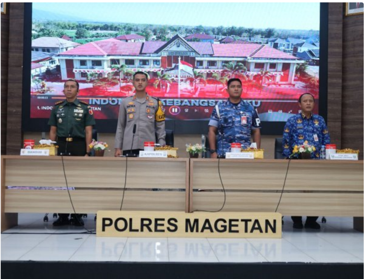
Dandim 0804/Magetan Hadiri Rakor Lintas Sektoral kesiapan operasi lilin 2024

Magetan. – Guna meningkatkan Sinergitas dalam rangka kesiapan operasi lilin 2024 pengamanan Hari Raya Natal 2024 dan Tahun Baru 2025 di wilayah Kabupaten Magetan yang aman dan kondusif.