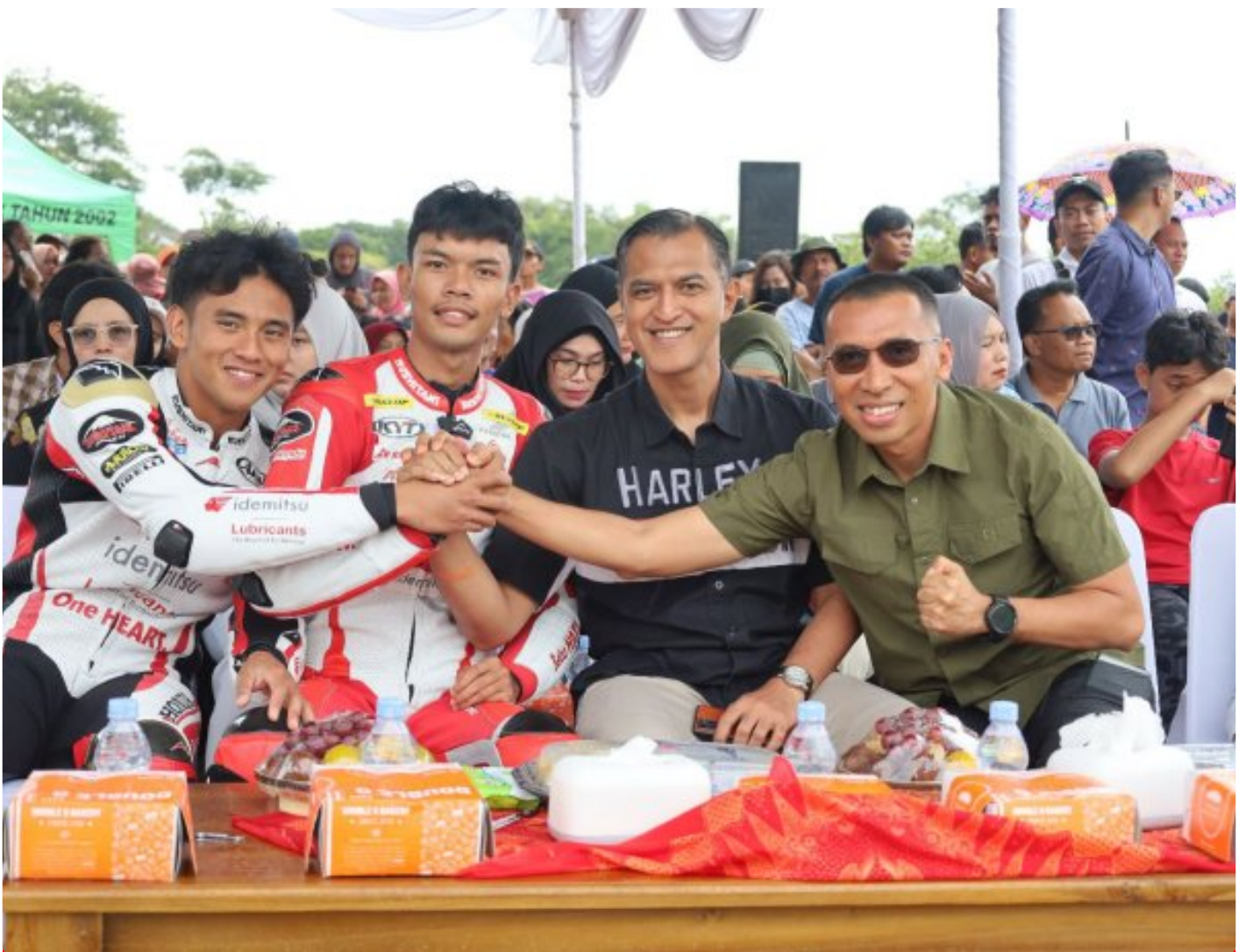
Dandim 0804/Magetan Hadiri Undangan Tinjau Sirkuit Magetan