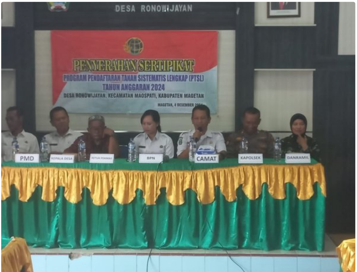
Danramil 0804/06 Maospati Hadiri Penyerahan Sertifikat PTSL Desa Ronowijayan

Magetan. - Bertempat di Balai Desa Ronowijayan, Kecamatan maospati,